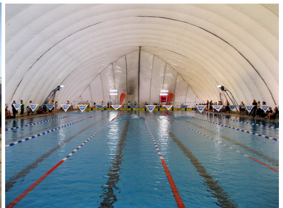
Traglufthalle Schwimmbad Mainzer Schwimmverein gGmbH